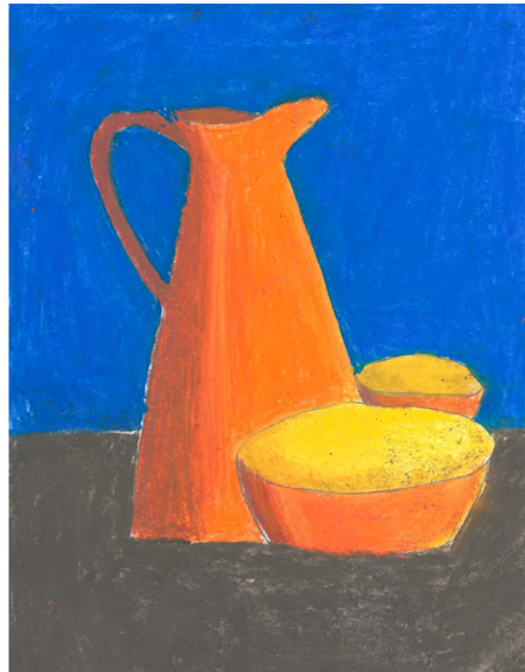
Illustrationer fra Årsskriftet 2024

En bredt sammensat bestyrelse er også noget vi har tilstræbt, og vi har aktuelt har en bestyrelse i Lilleskolernes Sammenslutning bestående af både skoleledere, bestyrelsesforpersoner samt et eksternt medlem. Det er muligt i vores aktuelle vedtægter og medlemsbegreb – og det forudsætter netop, at skolerne deltager og er repræsenterede ved andre/flere end deres skoleleder.