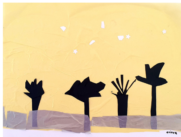
Illustrationer fra Åsskriftet 2023

Til Politiken udtalte hun: Livsomstændighederne er forskellige fra ung til ung, men vi ved, hvad der skaber trivsel og fremmer mental sundhed: Følelsen af nogen og noget at stå op til. At man er god nok. Hører til fællesskabet. Kan bidrage til noget, der rækker ud over en selv. Derfor kan fokus på, om den enkelte er hurtig, dygtig, smuk eller populær nok også være med til at presse børn og unge (...) Mange unge har en oplevelse af, at de konstant skal skynde sig og alligevel har svært ved at nå frem. Vi har gjort pauser og eftertænsksomhed, omveje og omvalg til noget forkert og uønsket i ungdomslivet.