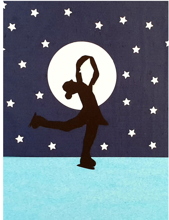
Illustrationer fra Åsskriftet 2023