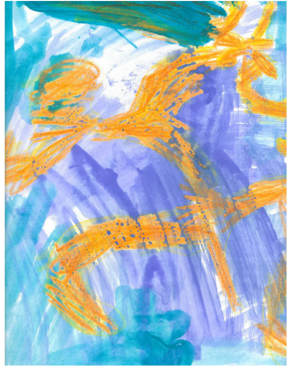
Illustrationer fra Årsskriftet 2024

Festivalen er en kæmpe manifestation og et vidnesbyrd om alt det gode pædagogiske og fagspecifikke arbejde, der går